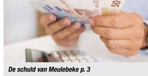
De schuld van Meulebeke p. 3