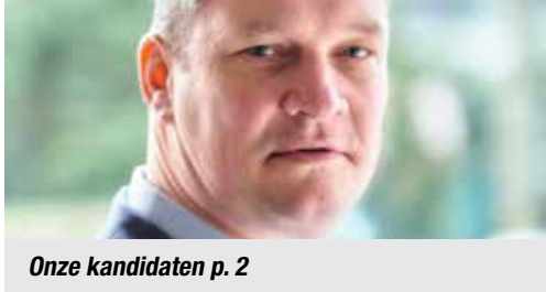
Onze kandidaten p. 2